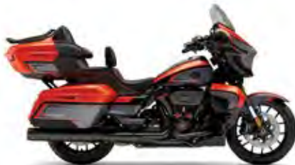
CVO™ STREET GLIDE® LIMITED