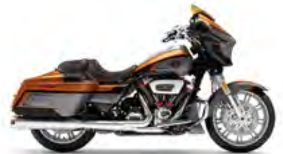
CVO™ STREET GLIDE®