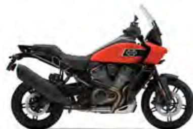
PAN AMERICA® 1250 SPECIAL