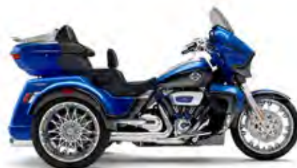
CVO™ STREET GLIDE® 3 LIMITED