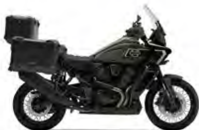
PAN AMERICA® 1250 LIMITED