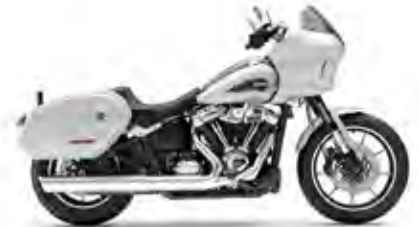
LOW RIDER® ST