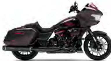
CVO™ ROAD GLIDE® ST