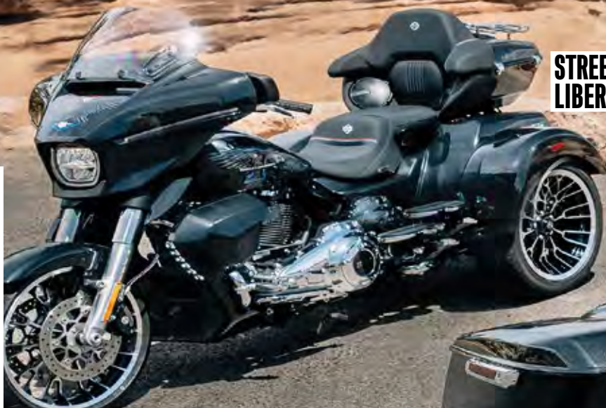
STREET GLIDE® 3 LIMITED LIBERTY EDITION