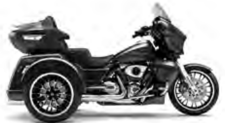
STREET GLIDE® 3 LIMITED LIBERTY EDITION