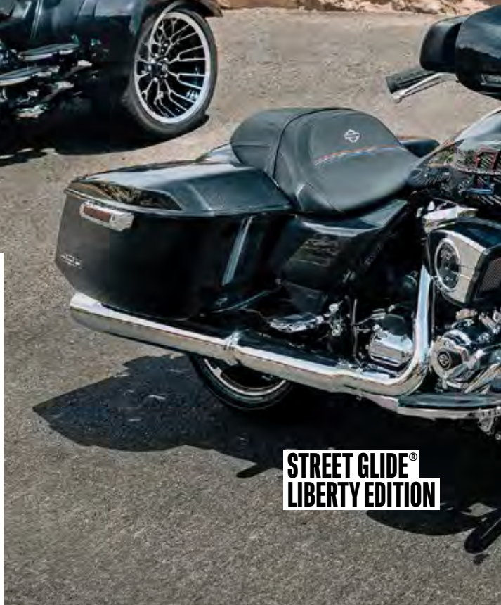
STREET GLIDE® LIBERTY EDITION